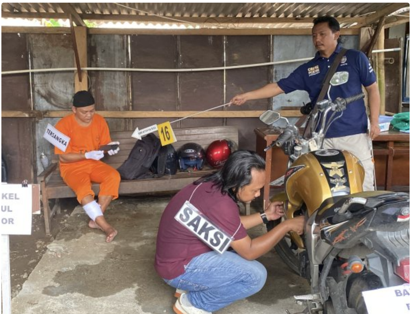
Polres Purbalingga Gelar Rekonstruksi Kasus Pembunuhan di Wirasana, 18 Adegan diperagakan

Purbalingga – Polres Purbalingga menggelar rekonstruksi kasus dugaan pembunuhan berencana yang terjadi di sebuah rumah kontrakan wilayah Kelurahan Wirasana, Kecamatan Purbalingga, Kabupaten Purbalingga, Kamis siang (4/12/2025).